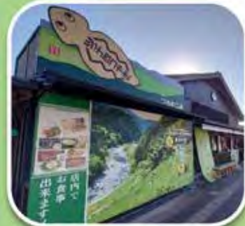
道の駅茶の里東白川