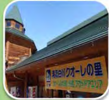
道の駅清流白川クオーレの里