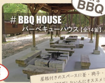
# BBQ HOUSE バーベキューハウス【全14釜】