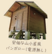
安価な山小屋風 バンガロー(電源無し)