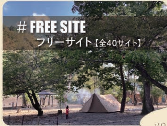
# FREE SITE フリーサイト【全40サイト】

区画が無く自由度の高いテントサイト お気に入りのテントを持ってGO! (デイキャンプも同エリア)