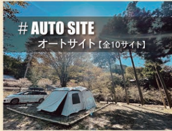
# AUTO SITE オートサイト【全10サイト】

木々に囲まれた広さ約100㎡の区画サイト 電源付きで初心者や冬キャンプにも最適♪