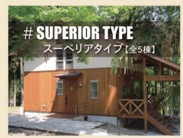
# SUPERIOR TYPE スーペリアタイプ【全5棟】