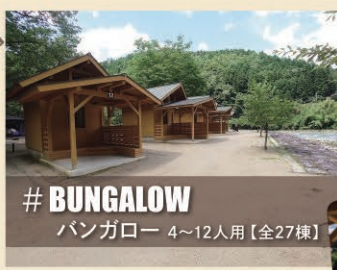
# BUNGALOW バンガロー 4～12人用【全27棟】