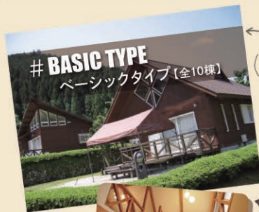
# BASIC TYPE ベーシックタイプ【全10棟】

コテージは設備の整った貸別荘スタイルの宿泊施設です。 全棟Wi-Fi完備! お車も敷地内に駐車しておくことが可能です。 快適にアウトドアを楽しみたい方におすすめです♪